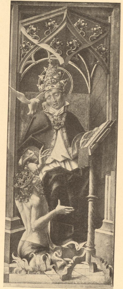
Abb. 130. Alte Kopie aus dem 15. Jahrh. von Abb. 129 Innsbruck, Ferdinandeum.