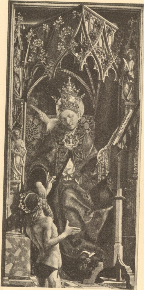
Abb. 129. Hl. Gregorius den Kaiser Trajan vom Fegfeuer erlösend München, Alte Pinakothek.