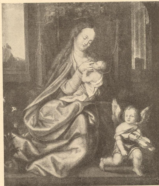
Abb. 79. Madonna, A. Dürer (?), Graz.

er links den ausladenden Gewandbausch nach unten sich runden, statt wie Dürer die Ähnlichkeitsbeziehung zu dem zweiten darüber ansetzenden Motiv zu suchen. Die Figuren erscheinen trotz der ansprechenden Halbkreisform ihrer oberen Silhouette in der Einfachheit ihrer Gewandgliederung als Zutaten, die den Gedanken der Mittelgruppe nirgends weiterführen, doch bleibt auch für das Grazer Bild der symmetrische Hintergrund bedenklich, der auf die Gruppengliederung nirgends eingeht.