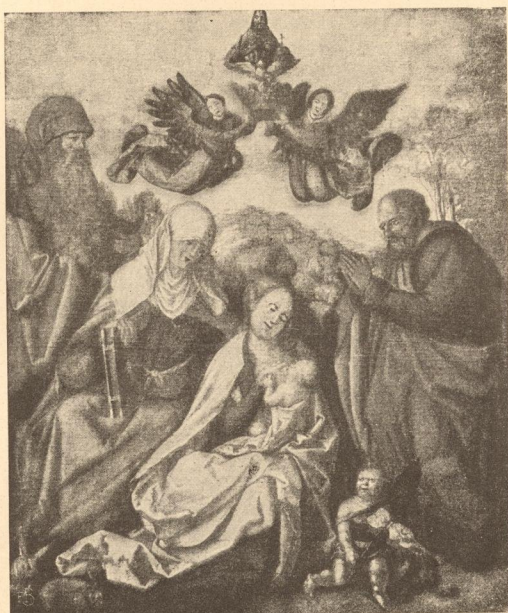
Abb. 78. Heilige Familie, Schule Dürers, Germanisches Museum in Nürnberg.