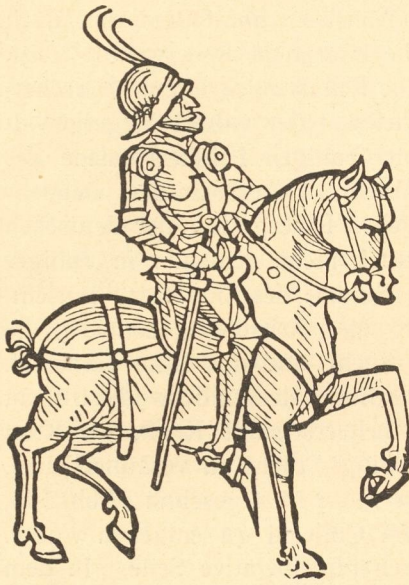
Abb. 54. Der christliche Ritter, Holzschnitt des 15. Jahrhunderts.

Priesters um die breiten Schultern, schlägt die alten Schriften selber auf, die ihm in eigener Sprache zugänglich gemacht werden und beginnt mit kritischem Auge zu lesen, was es früher in Andacht nur gehört hatte. In Italien blieb die Kunst viel mehr in dem Dienst der Kirche und des vornehmen Herrn. Die breiten Wände der ehrwürdigen Städte schmückten sich dort mit großen Fresken, die in zyklischen Darstellungen das Leben der Gegenwart in der religionsgeschichtlichen Vergangenheit sich abspielen ließen, eine glänzende Kunst für den Festtag der Kirche. In Deutschland aber blieb entsprechend den allgemeinen Verhältnissen der Zeit die Kunst wie im Mittelalter mehr Erbauungs- und Bildungsmittel. Indem sie den religiösen Bedürfnissen entgegenkam und doch zugleich mitten hinein in das pulsierende Leben der Gegenwart griff, mußten sich die Grenzen von diesseits und jenseits von selber verwischen und auch das schlichte Dasein in das Reich des Wunderbaren hinüberleiten. Der pan-