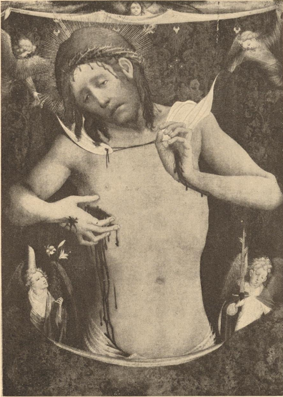
Abb. 31. Francke, Ecce homo, Hamburger Schule um 1430.