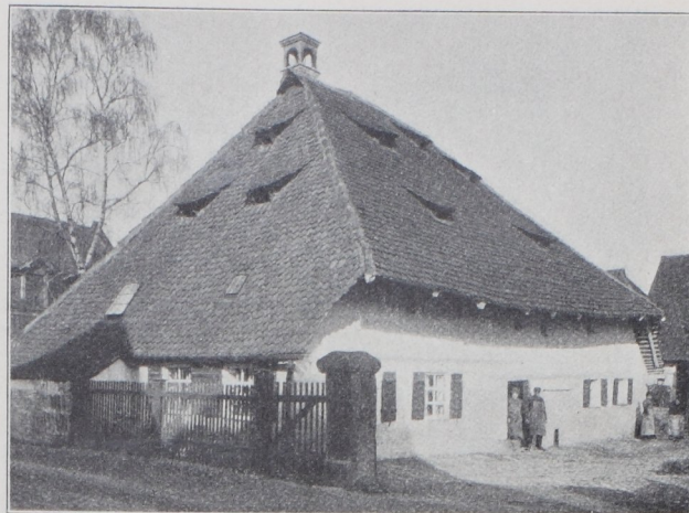
Abb. 39. Haus Lottes in Großreuth bei Nürnberg. 1686.

überdeckung ist die häufigste, stattliche profilierte Einfahrtstorbögen mit kleinen Türbögen daneben, die Wand mit Abdeckgesims oder mit Ziegeldeckung versehen die Regel. Die spätere Renaissance überdeckt nur die Türöffnung, manchmal in reichem, architektonischen und figuralen Aufbau 1) , oder sie stellt lediglich kräftige Steinpfeiler auf zur Befestigung der Torflügel und bildet dieselben aus mit ornamentalen Füllungen der Vorderseiten der Schäfte, mit Kapitälchen, Kugel- oder Urnenaufsätzen.