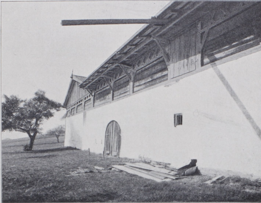
Abb. 18. Stalleder in Reuth. Außenseite. Niederbayern.

sind fast sämtliche Hausfronten mit einer dicken Putzschicht überzogen, welche das Zimmerwerk verhüllt und vor Feuergefahr schützen soll. Nur das energische Giebeldach kündigt noch die Bauart des Gebirges an.