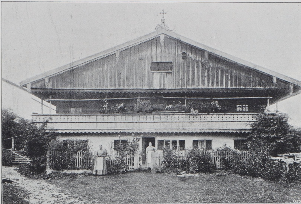
Abb. 7. Straßerhaus in Schlegeldorf, Isarwinkel.

Die Stube mit dem großen Ofen und mit ihrer stets gleichen Einrichtung, von Wandbänken, Tisch, Ofen und Wandschränken, ist für einen behaglichen Aufenthalt geschaffen, zur Ruhe nach der Arbeit, zum Empfang der Besuche und zum Genuß des Feiertages. Der Raum, ein Quadrat von fünf bis