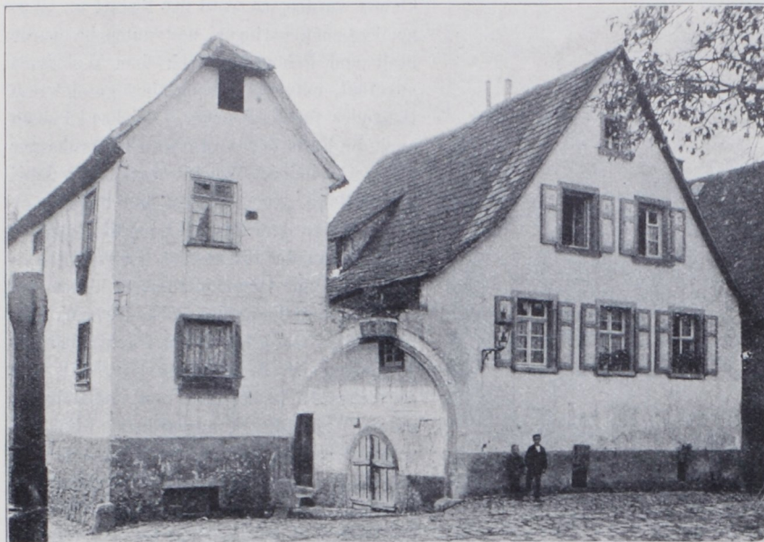
Abb. 3. Gehöft in Grötzingen bei Durlach. Erbaut 1604.

dient als Weinkeller. Von der Hauseingangstüre nach hinten zu erblicken wir eine Kammer und unter derselben einen Kartoffelkeller; es folgt ein Stall, dann die Scheuer und ein Schopf. Über Stall und Schopf liegen Heuböden. Am hinteren Ende des Hauses ist eine gemauerte »Kalter« (Raum zum Winkeltern) angeordnet. Die Dungstätte befindet sich zwischen Gebäude und Straße.