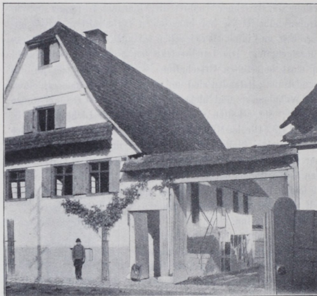
Abb. 4. Bauernhaus in Berghausen bei Durlach.