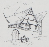
Abb. 1. Börsch 1723. Weinbauern-Haus.

Endlich finden wir im Hanauerlande (ehemalige Grafschaft Hanau-Lichtenberg, U.-Els.), in einer den Vogesendörfern verwandten Art, den Hof ringsum mit Gebäuden umstellt dadurch, daß auch die Einfahrtseite überbaut ist. Diese Bildung zeigen die großen Hofanlagen. (Vgl. Taf. 3 und 4 und Textabb. 30.)