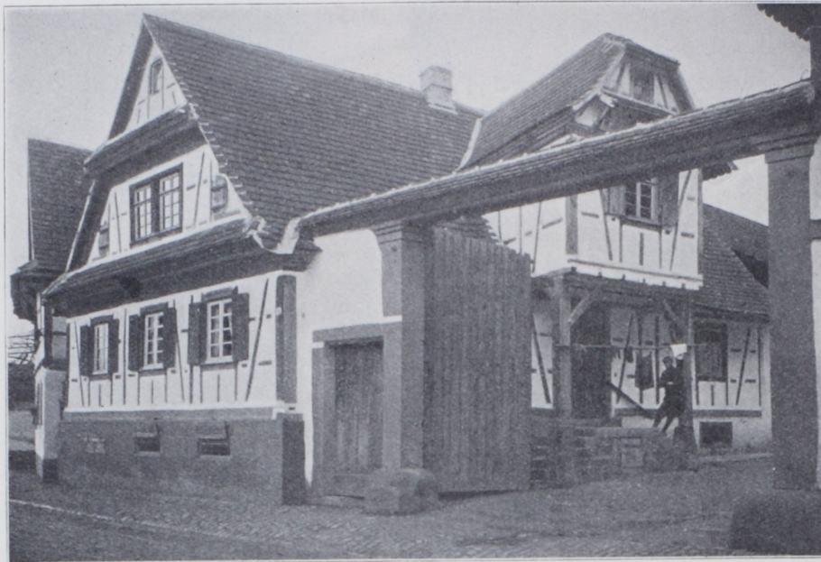
Abb. 12. Bauernhaus in Bellheim (Rheinebene). 1840.

toffeln. Der Schweine- und Federviehstall schließt das Viereck des Hofes, im Verein mit dem Einfahrtstor, vollends ab. Dieses Gebäude hat zwei niedere Geschosse: im unteren befinden sich die Schweine, im oberen das Federvieh. Über der Waschküche liegt die Knechtekammer.