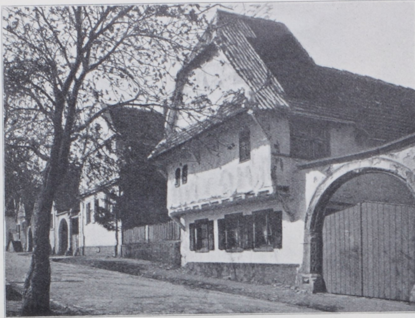
Abb. 4. Bauernhaus in Rhodt. ca. 1600.