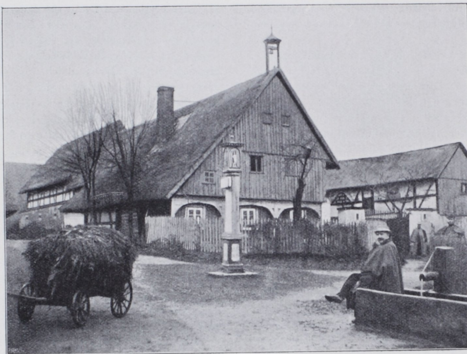
Abb. 11. Piscowitz (Amtsh. Kamenz) Sächs. Oberlausitz.

Die konstruktive Durchbildung der Nebengebäude bietet in Sachsen nichts besonders Bemerkenswertes. Der außerordentliche Reichtum des Landes an Baustoffen aller Art hat auch hier die mannigfaltigsten Gestaltungen sowohl für die raumbildenden Bauteile als auch für die Ausstattung der Innenräume bedingt. Weit aus am häufigsten — namentlich