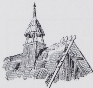
Abb. 8. Dunsthaube als Dachreiter über einem Strohdache.

Die Scheune erhält fast immer die Querstellung an der Rückseite des Hofes, so daß die allgemein übliche Quertenne zugleich eine hintere Ausfahrt auf das Feld bildet (Taf. 6, Abb. 6 sowie Taf. 5, Abb. 4). Längs der Tenne liegt mindestens einerseits die Banse, ein bis unter das Dach offener Raum, während die Tenne mit Brettwänden etwa bis Mannes-