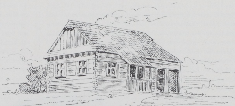
Abb. 12. Gasthaus mit Altanka im Kreise Rybnik.

Eine höhere Stufe der wirtschaftlichen Entwicklung bedeutet die Gliederung des Grundrisses, wie sie sich in der Umgegend von Solschwitz zwischen Hoyerswerda und Kamenz in Sachsen, in einer rein wendischen Gegend findet (vergl.