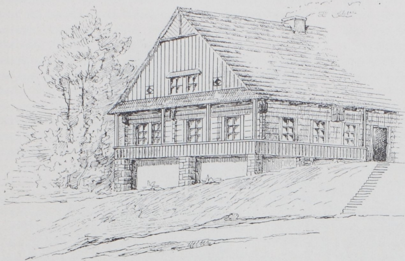
Abb. 11. Aus dem Erlitztale.

Rybnik findet (Textbild 12). Hier ist das Dach des eingeschossigen Hauses vor der Türe heruntergeschleppt und ruht in der Regel auf vier unten durch eine geschlossene Brüstung verbundenen Stielen, so daß sich ein bedeckter Sitzplatz ergibt.