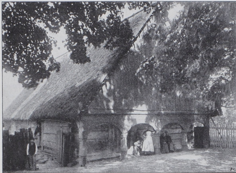
Abb. 6. Gehöft in Peterawe, Kreis Samter. Ansicht des Wohnhauses.