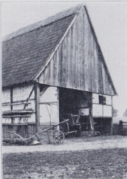
Abb. 5. Paothues, Hof Lütke Verspoel in Roxel, Landkr. Münster.

Der Wirtschaftshof erstreckt sich vor und neben dem in der Achse des Torhauses angelegten oder bei beschränktem