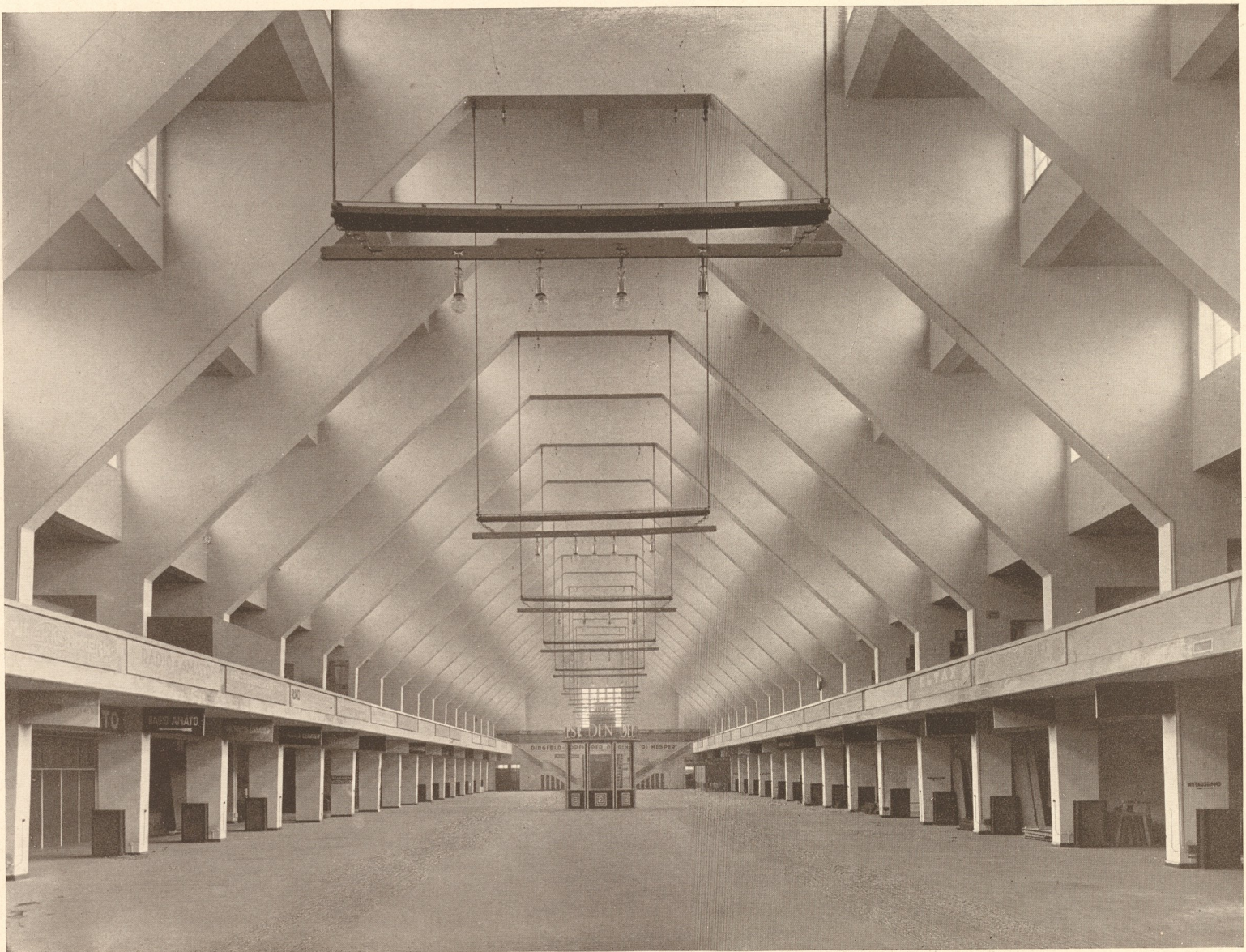
Inneres der Halle.

Das Haus der Deutschen Funkindustrie. Berlin-Witzleben.