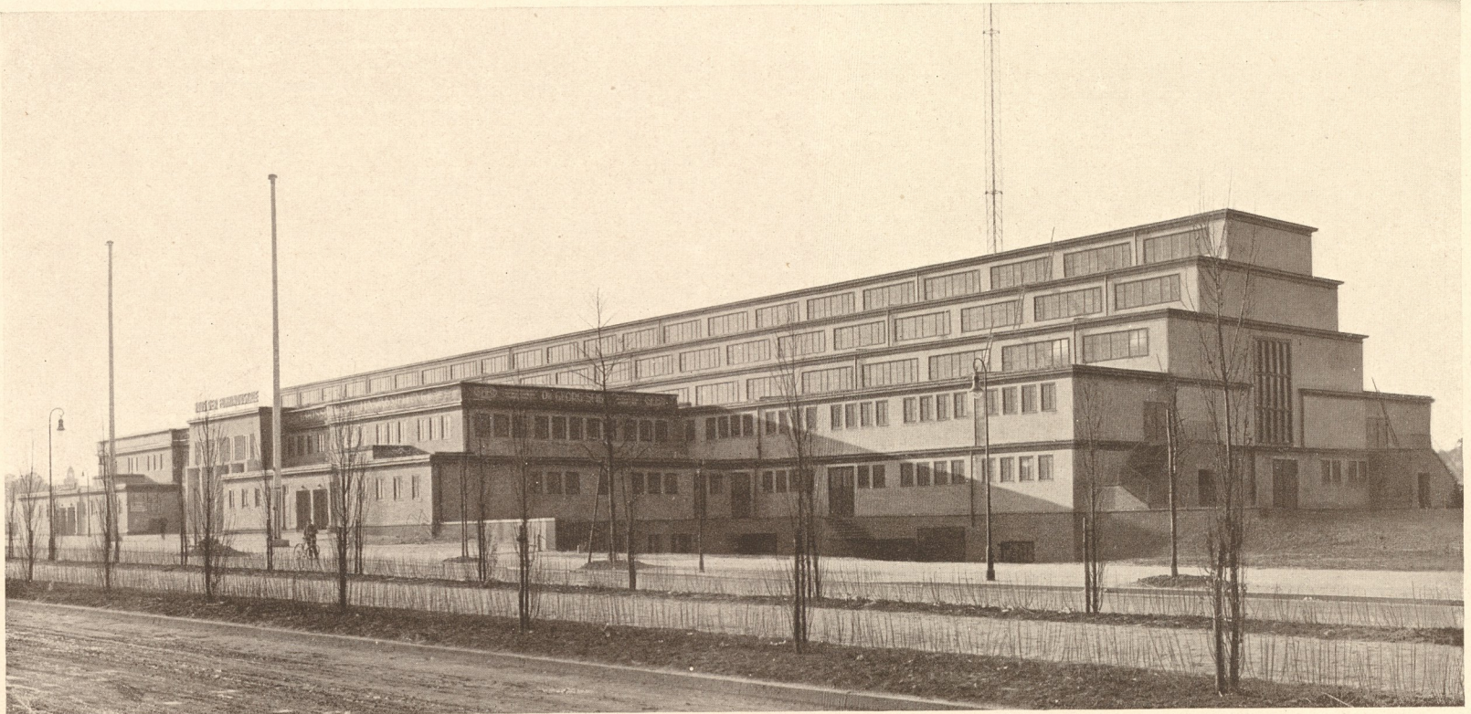
Gefamtanlicht — Eingangsseite.