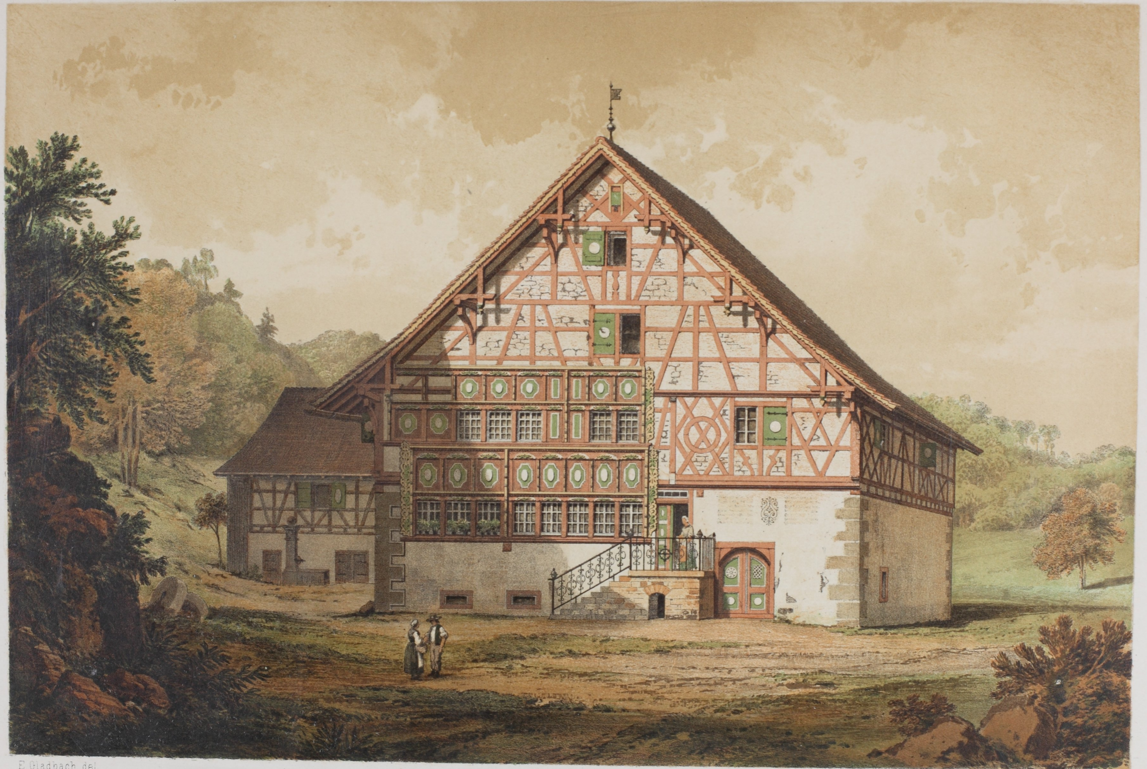
E Gladbach del.