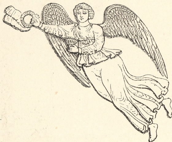
Fig. 72. — Victoire ailée.

Des scènes de chasse, fort compliquées, tapissent les murs latéraux. La troisième face de la pièce est divisée en deux sections. Dans le registre inférieur, un bas-relief équestre représentant Kosroës armé de toutes pièces, casque en tête et lance au poing (fig. 103). Le portrait du roi est compris entre deux pilastres et surmonté d'une litre garnie de feuillages (fig. 74). Tout le registre supérieur est occupé par une scène symbolique. Je ne parlerai pas des reliefs qui seront décrits plus tard 1 , mais je mettrai en parallèle le Tagè Bostan et les six chapiteaux sassanides d'Ispahan.