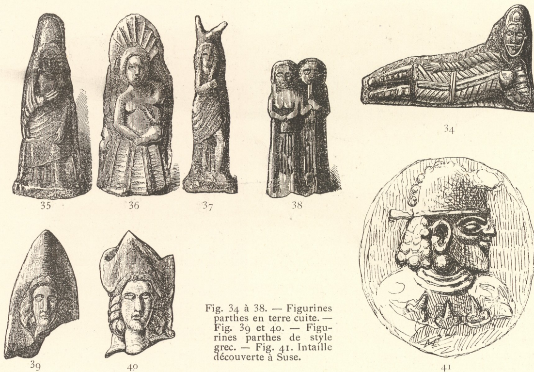
Fig. 34 à 38. — Figurines parthes en terre cuite. — Fig. 39 et 40. — Figurines parthes de style grec. — Fig. 41. Intaille découverte à Suse.

et la dimension de l'œil, l'oreille retournée, le style du profil, de la chevelure et de la barbe attestent la chute profonde des arts locaux. Ce sceau n'en est pas