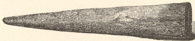
Fig. 25. — Cône de terre cuite, grandeur naturelle ( Chal. and sus , Loftus, p. 187).

On usait en Assyrie de ces mélanges de tons heurtés, et pourtant harmonieux, qui deviendront d'un emploi usuel sur les rives du Bosphore et même en