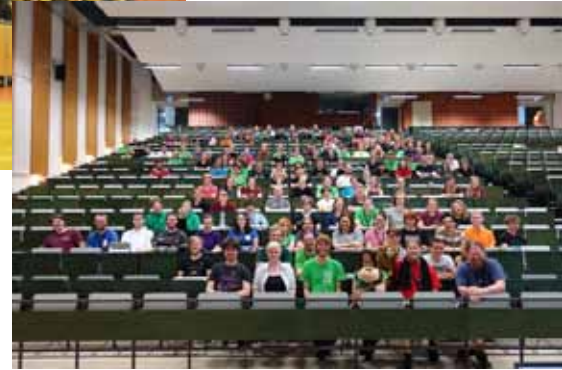
Plenum KIF&KoMa Regensburg