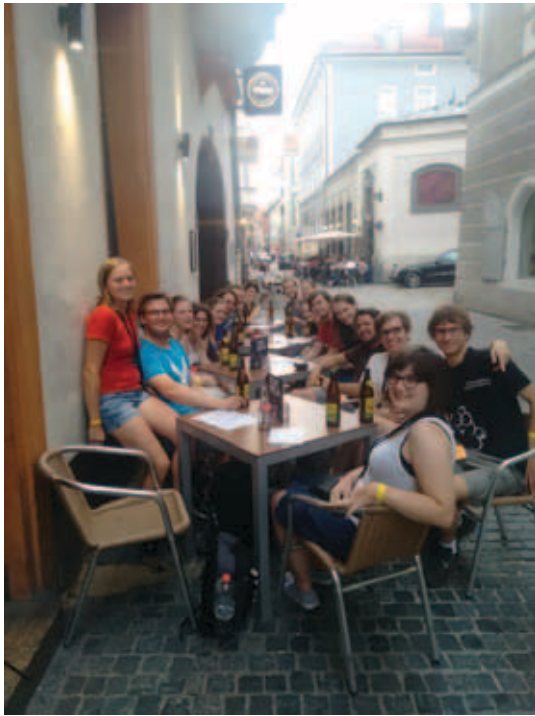
StudienvertreterInnen aus Österreich auf der KIF&KoMa in Regensburg