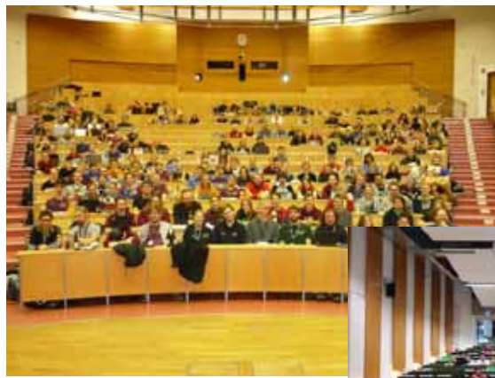
Plenum KIF Ilmenau