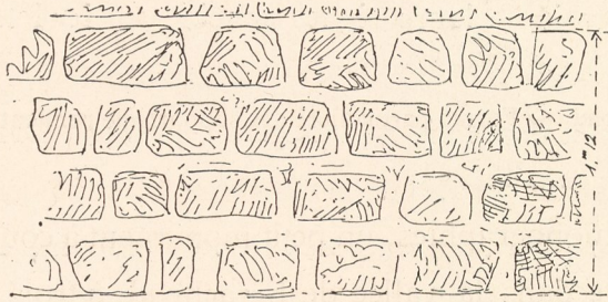
Fig. 54. — Mur achéménide des réservoirs de Persépolis.

de barbarie qu'au temps de Firouz-Abâd. Il existe, en particulier, dans les environs de Persépolis, des spécimens de murs achéménides (Fig. 54) bien supérieurs comme exécution à ceux qui nous occupent (Fig. 55).