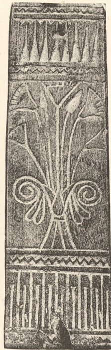
Fig. 29 bis.

Objets en bois (Fig. 29 et 29 bis) et en terre émaillée (Fig. 30 et 30 bis), de fabrication thébaine, décorés d'ornements lotiformes (Musée du Louvre).