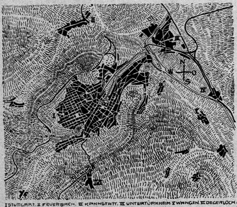
Lageplan der Stadt Stuttgart 157) .