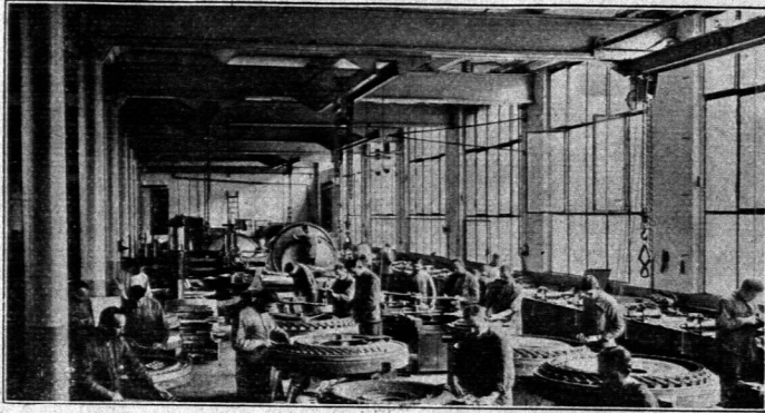
Kleine von Hand betriebene und auf den Unterflanschen von Unterzügen laufende Krane, die nur je ein kleines Feld bestreichen.