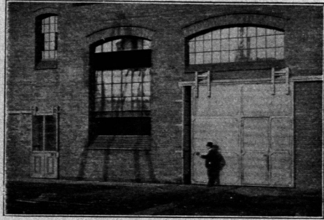
Schiebetor und Schiebetür; außenlaufend Konfr. nach P. Tropp -Berlin-Halenfee.