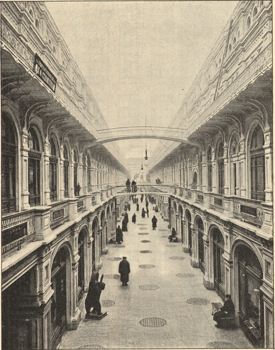
Neue Handelsreihen zu Moskau.