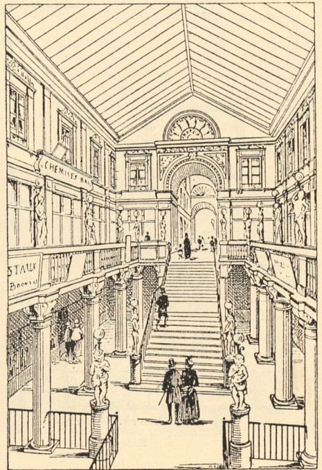
Passage Pommeraye zu Nantes 40) .