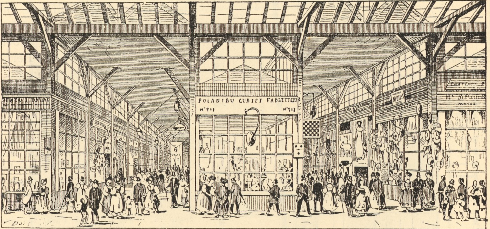
Passage im alten Palais Royal zu Paris 40) .