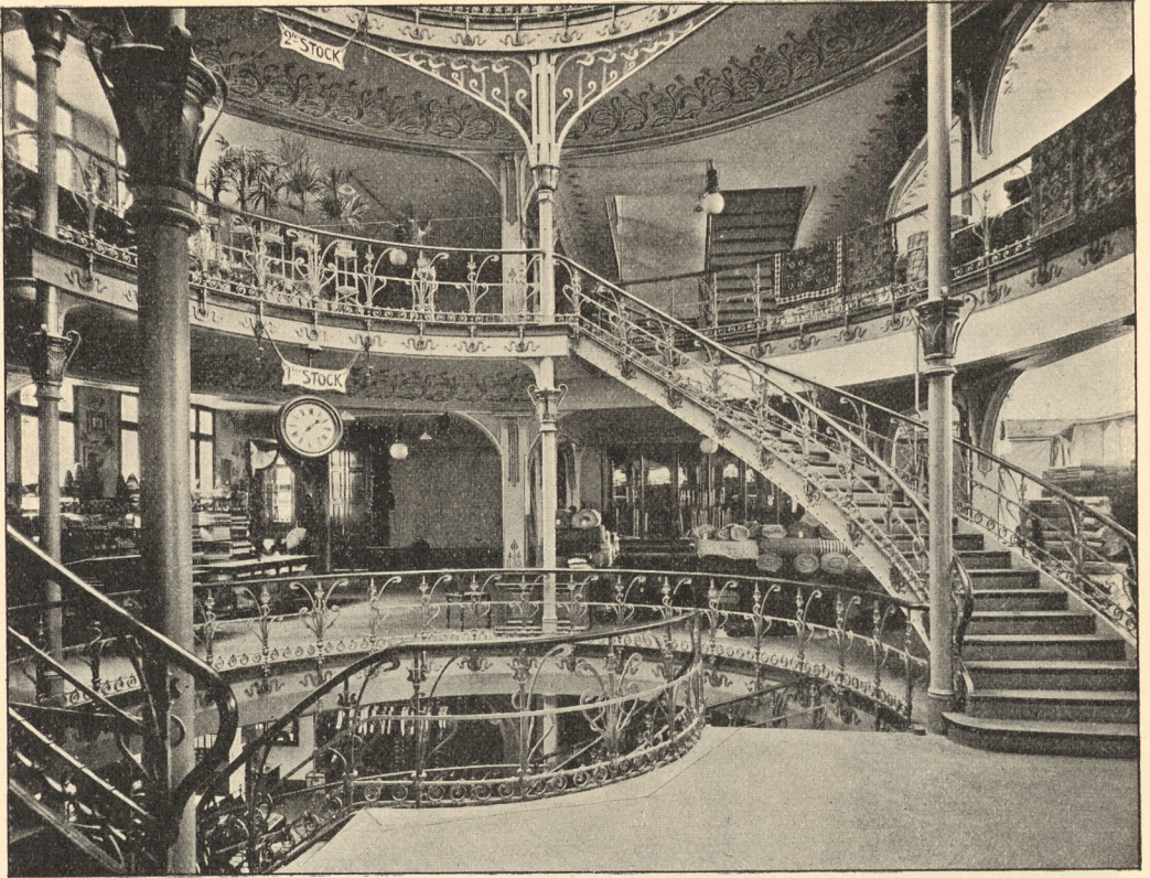
Innenansicht des Verkaufsraumes.