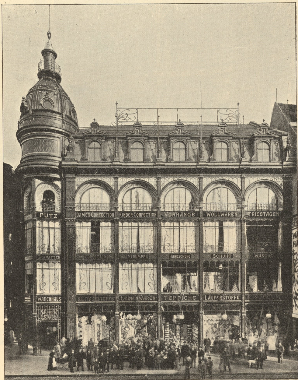
Warenhaus Knopf zu Strassburg, Ecke der Gewerbslauben und des Dominikanergäßchens.