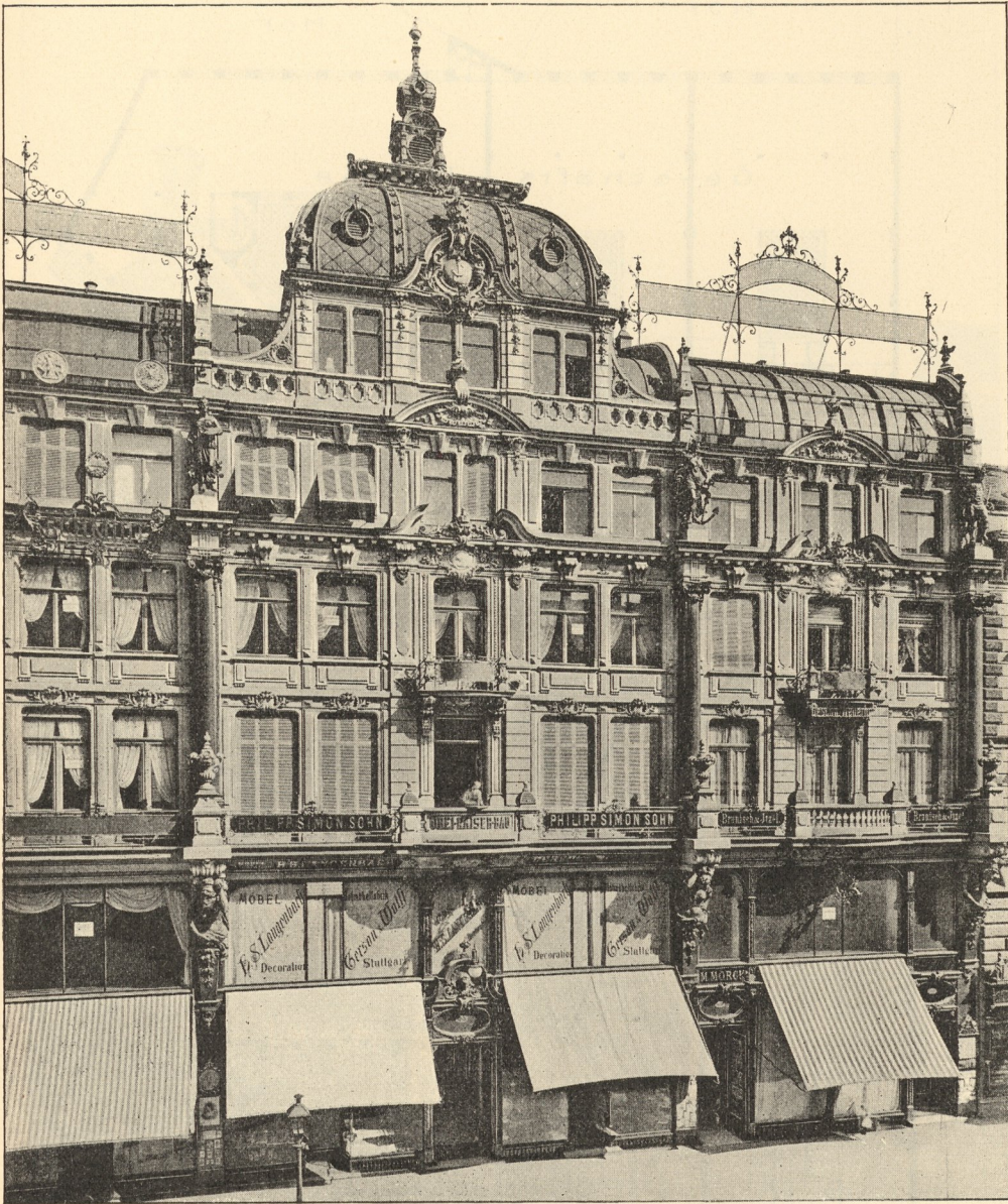
Dreikaiferbau zu Frankfurt a. M., Ecke der Kaisertrasse und des Roßmarktes.