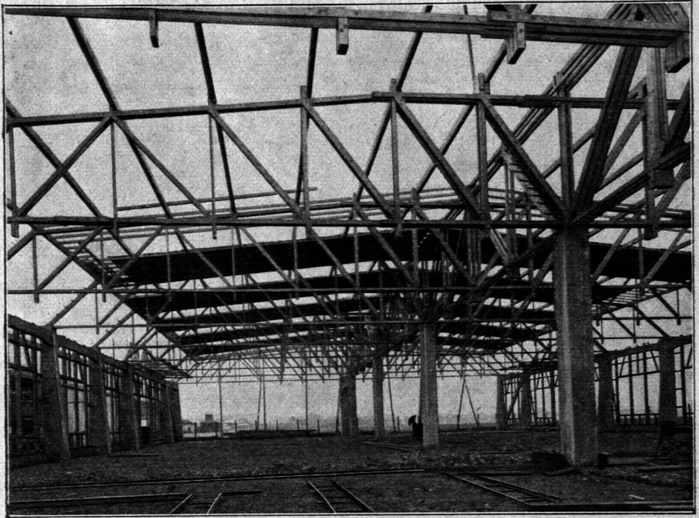
Halle mit Bindern (Spannweite 2 \times 20 m) der Unternehmung für Hoch- und Tiefbau Karl Kübler in Stuttgart.