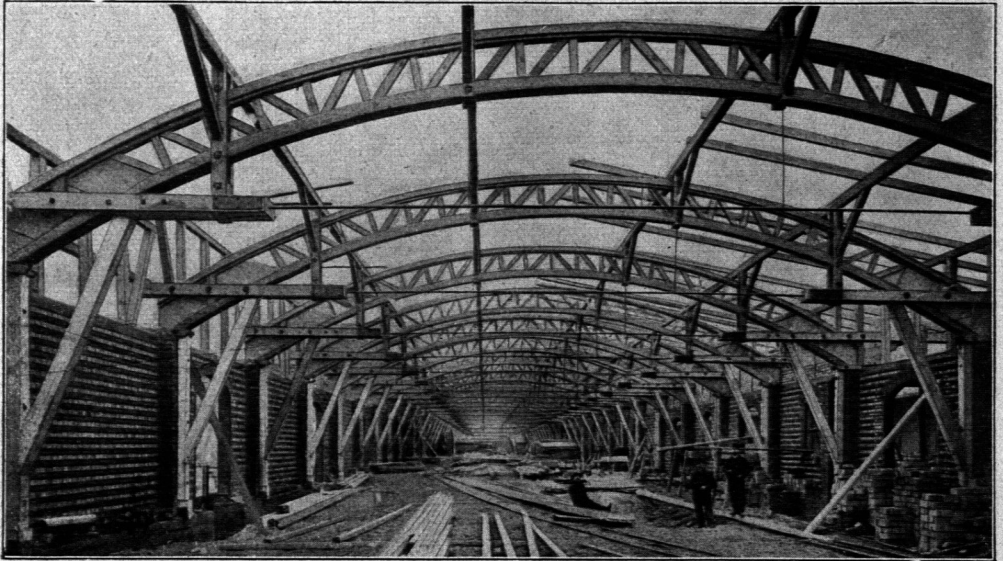
Lagerchuppen mit Dachbindern Sytlem Stephan-Düffeldorf . (Vergl. auch Fig. 101.)