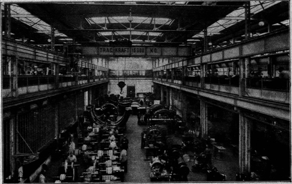
Werkstätte der Österr. Siemens-Schuckert-Werke , Leopoldsdau-Wien.

Größere Hallenhöhen ergeben sich natürlich auch bei der Notwendigkeit, mehrere Kranbahnen übereinander anordnen zu müssen.