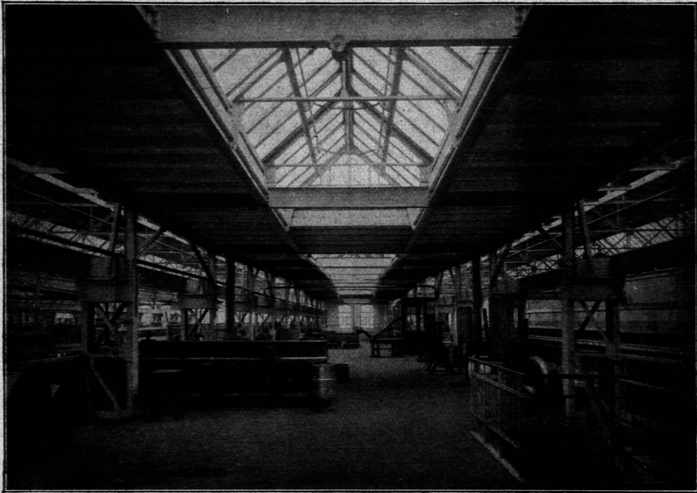
Blick auf die Arbeitsbühne. (Vergl. Fig. 103.)