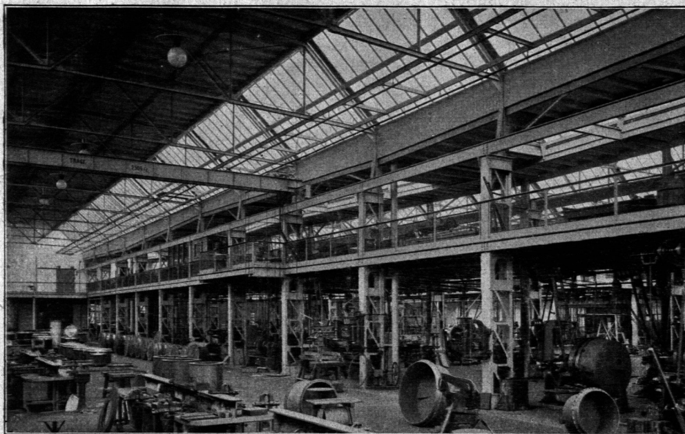
Werkstätten der Hildesheimer Sparherd-Fabrik A. Senking -Hildesheim. Entw. P. Tropp -Berlin. (Vergl. auch Fig. 103.)