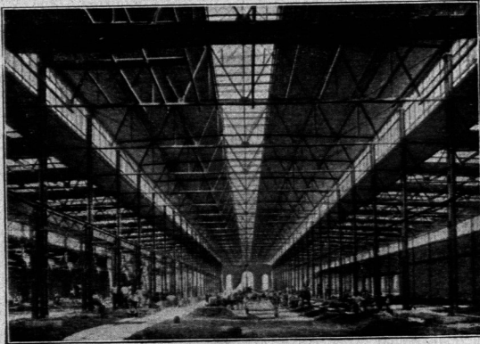
Gießerei der Armaturenfabrik Bopp & Reuther in Mannheim-Waldhof; ausgef. von der MAN, Werk Guftavsburg.

teilen sind, daß sie keine wertvolle Grundflächen in Anspruch nehmen und doch bequeme Verbindungen zwischen den unteren und den oberen Arbeitsflächen herstellen. Die durch eine Mittelhalle getrennten Flächen der Arbeitsbühnen