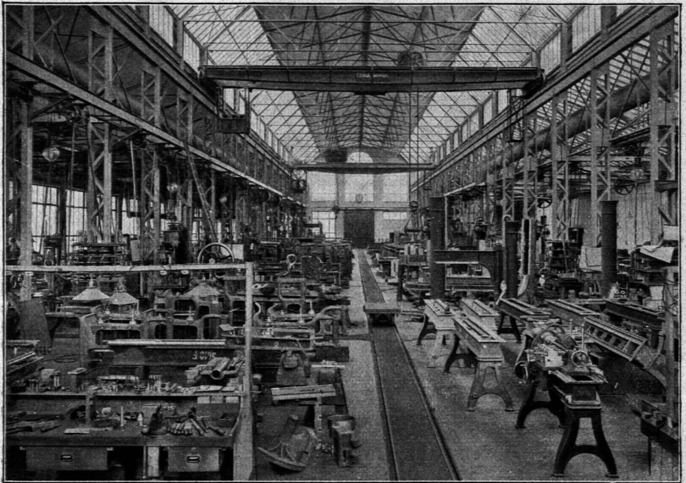
Werkstätten der Ludw. Loewe & Co.-A.-G. in Berlin-Moabit.