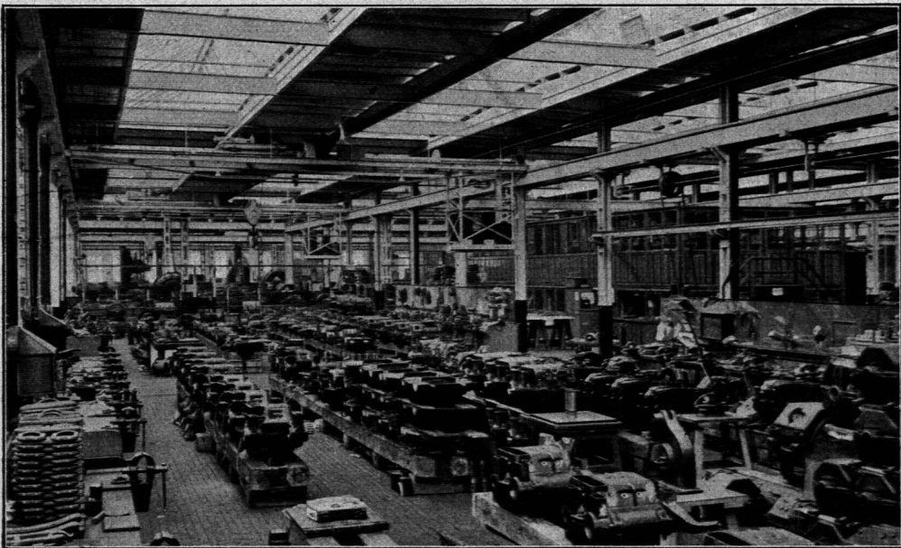
Werkstätte für Bahnmotoren; Siemens-Schuckert-Werke in Berlin-Siemensstadt.