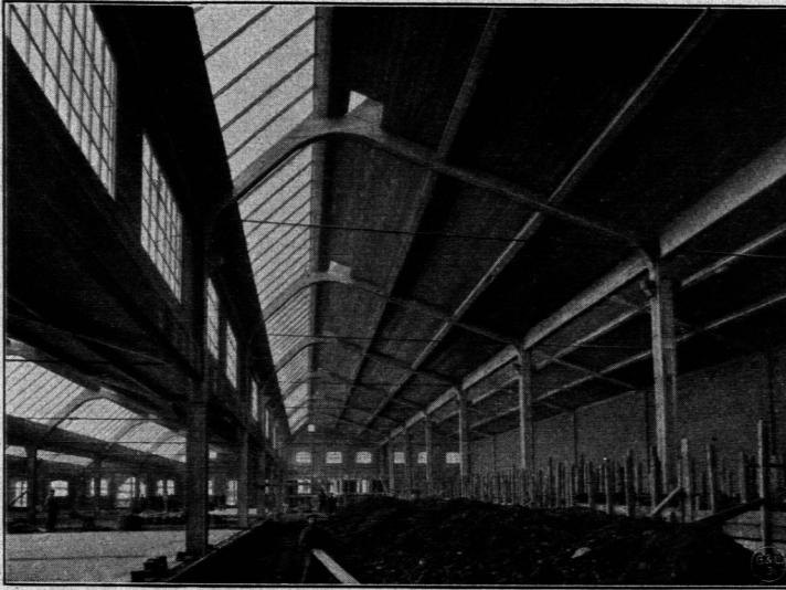
Sägeheddach in Eisenbeton mit Zugband 20) . Ausführung: Bauunternehmung Dücker & Cie. -Düffeldorf.