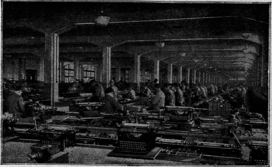
Einblick in den Werkfaal für Schreibmaschinenbau 14) .