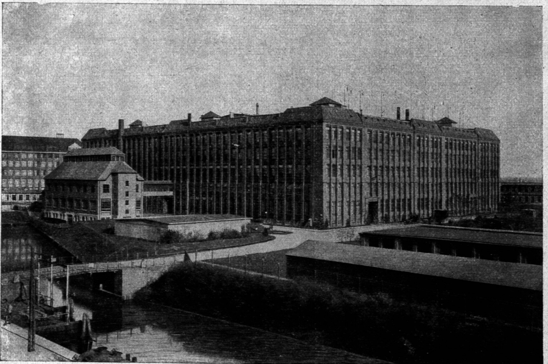
Das Kleinbauwerk der Siemens-Schuckert-Werke , Berlin-Siemensstadt. Entw. und erbaut von der Bauverwaltung der Siemens-Schuckert-Werke 8) .

Das Gebäude hat 5 Geschosse mit je 3 hufeisenförmig zusammengereichten großen Werkflälen, die durch zwei kleine Querbauten verbunden sind, in welchen letzteren