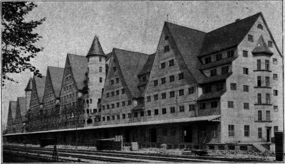
Lagerhaus der Stadt Köln a. Rh. Erbaut vom Stadtbauamt Köln.