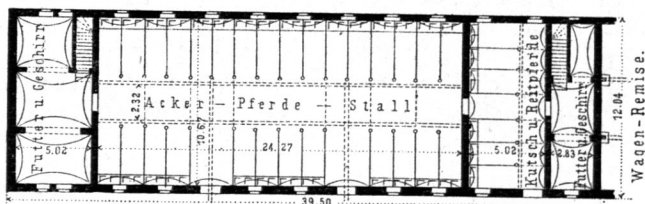
Pferdestall auf einem Gute in Schlesien. — 1/500 n. Gr.