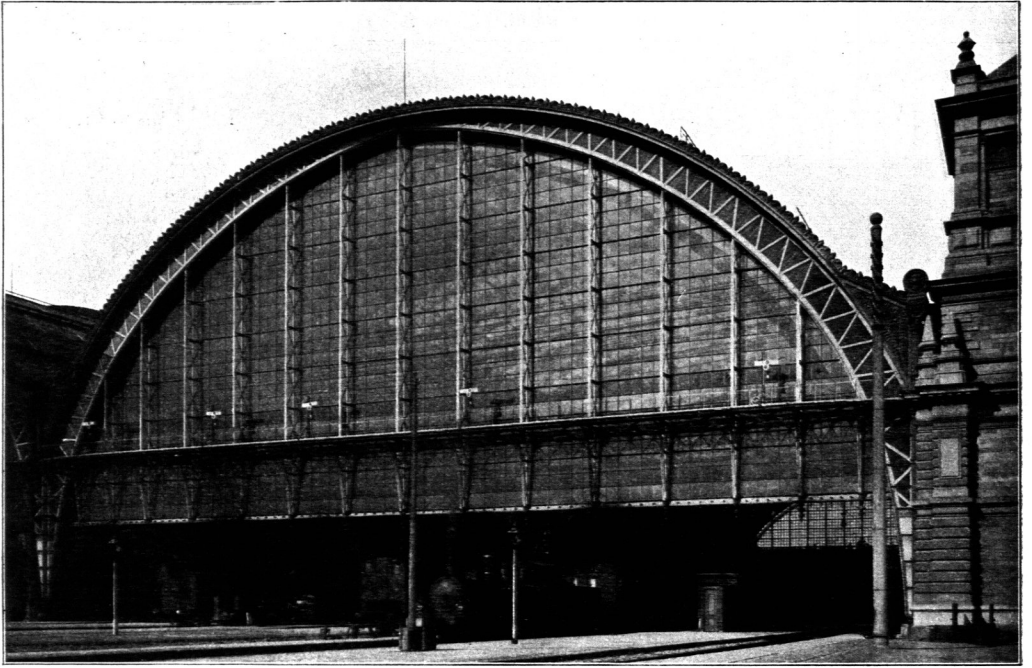
Endabfluß der Bahnsteighallen auf dem Hauptbahnhof zu Frankfurt a. M.

(Siehe auch Fig. 167 [S. 192], 428 [S. 356], 439 u. 440 [S. 364 u. 365].)