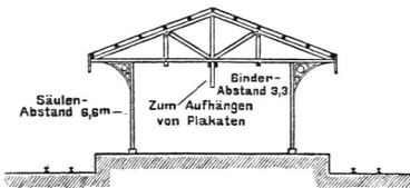
Bahnsteigdach auf dem Bahnhof zu Nagano 254) .

Bei dem gewählten Beispiele hat die dem Empfangsgebäude zunächst gelegene Dachfläche im Interesse der Erhellung Glaseindeckung erhalten, sonst ist Wellblech verwendet. Fig. 346 zeigt die Konstruktion des Daches, vor allem diejenige der fachwerkartig ausgebildeten Binder.