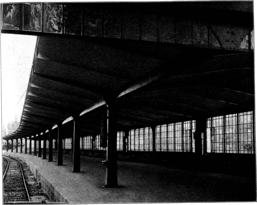
Überdachung der Wiesbadener Bahnsteige auf dem Hauptbahnhof zu Mainz.

Ausgeführt von der Vereinigten Maschinenfabrik Augsburg und Maschinenbaugesellschaft Nürnberg, A.-G.