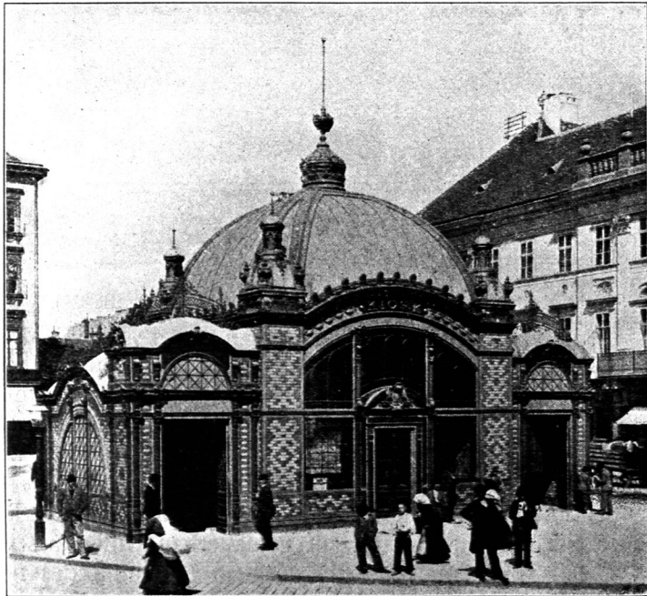
Schutzhäuschen am Deákplatz 215) .

Die Wiener Stadtbahn hat den Charakter und die Abmessungen der Hauptbahnen erhalten.