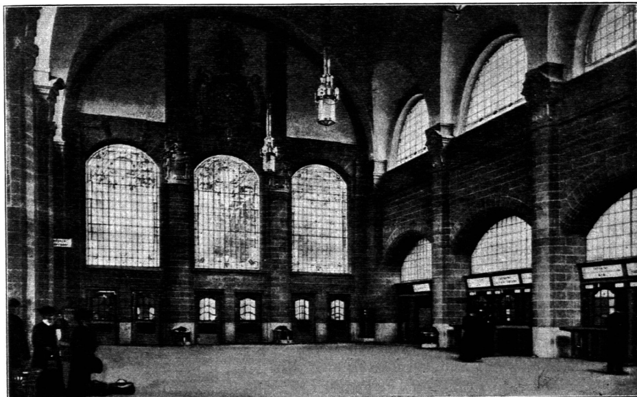
Eingangshalle im Empfangsgebäude des Bahnhofes zu Wiesbaden.