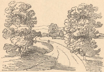
843. Bepflanzung Spazierweges 131) .