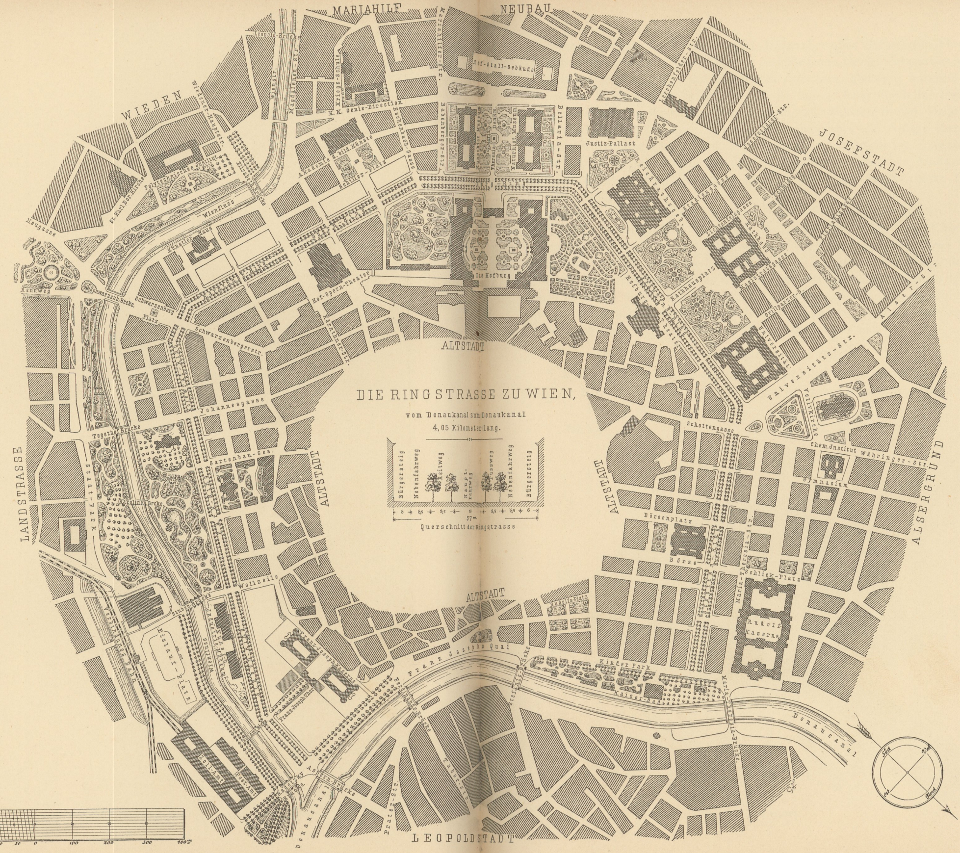
DIE RINGSTRASSE ZU WIEN, vom Donaukanal zum Donaukanal 4,05 Kilometer lang.